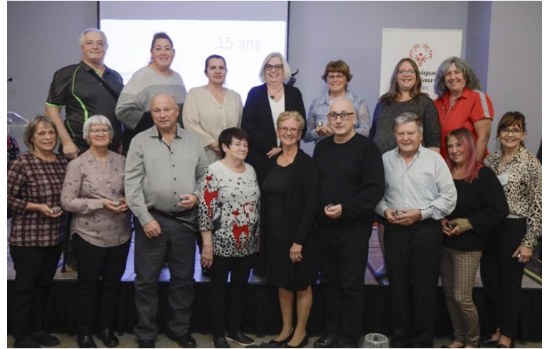
Gruppe de bénévoles • 15 ans