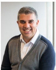
Toni Dilli Partenaires, Audit, KPMG