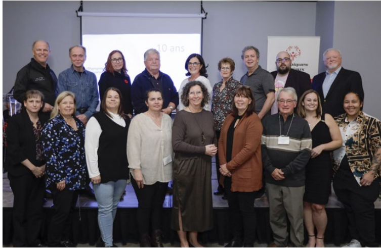
Gruppe de bénévoles • 10 ans