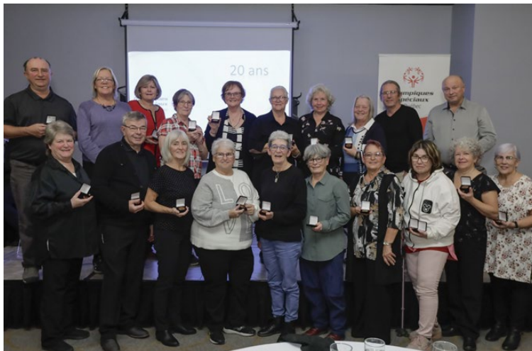
Gruppe de bénévoles • 20 ans